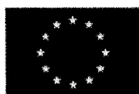
Unione europea Fondo sociale europeo